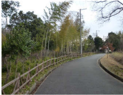
5 道なりに歩きましょう