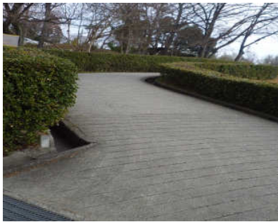
4 上り坂 ゆっくり行こう