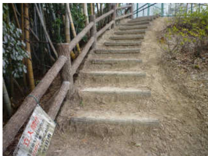
10 頑張って階段を上がりましょう