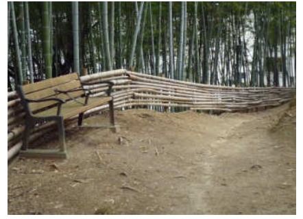
21 大きな道路に出るまでまっすぐです。