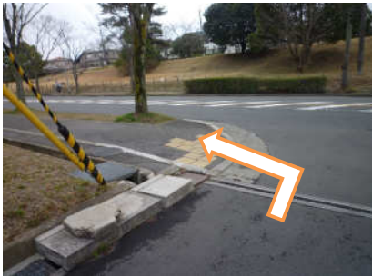
25 市民体育館の方へ左に曲がります