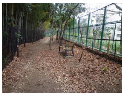
11 またベンチがありました