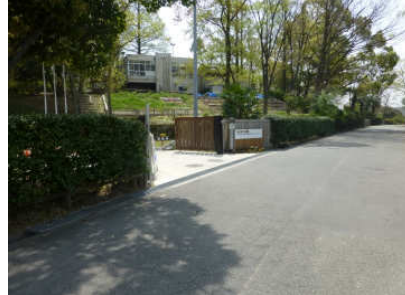
2 正面の門を超えて直進します