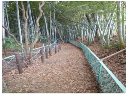
8 いろんな種類の柵(サク)をみつけられるかな