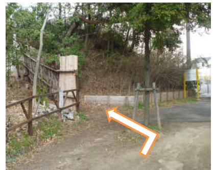
6 緑のネットワークの道に曲がりましょう(左に曲がります)