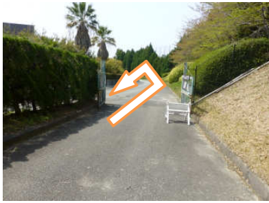
1 スタート 門を出て左へUターンしましょう