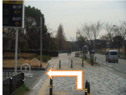
25 市民体育館の方へ左に曲がります