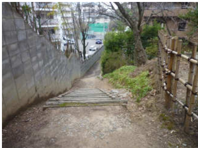
23 歩道をゆっくり歩きましょう