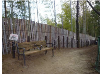
9 ちょっとひと休み!