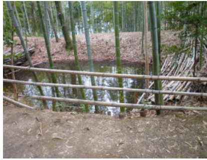
20 最後の下りです。あわてずゆっくり。