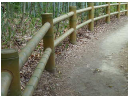
14 この柵(サク)は竹かな?