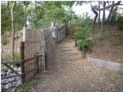
7 山の一番高いところ(尾根道)を歩きます