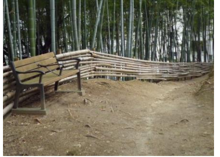
21 大きな道路に出るまでまっすぐです。