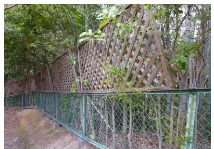
12 また、新たな柵(サク)が出てきましたよ