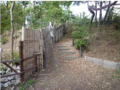
7 山の一番高いところ(尾根道)を歩きます