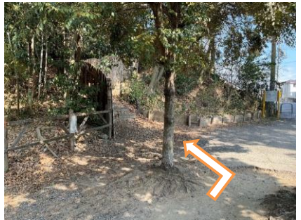
6 緑のネットワークの道に曲がりましょう (左に曲がります)