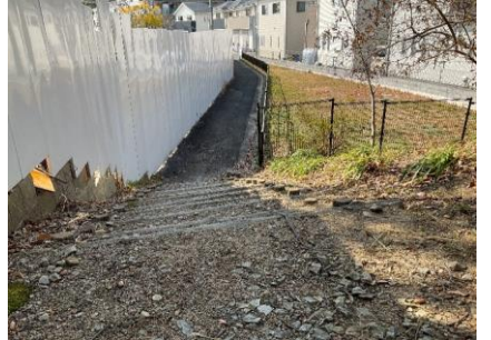
24 まだまだまっすぐ歩きます