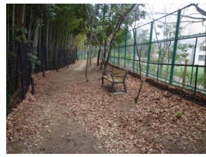
11 またベンチがありました