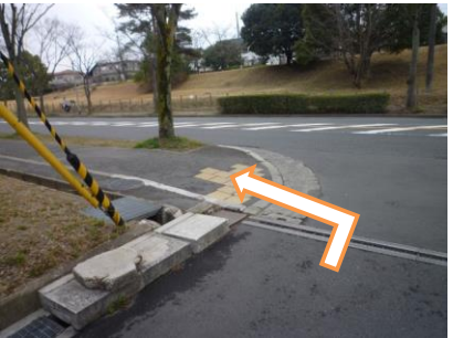
25 市民体育館の方へ左に曲がります