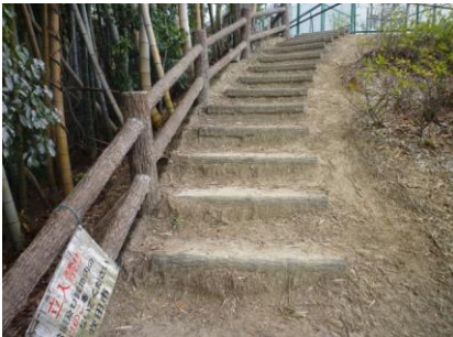
10 頑張って階段を上りましょう