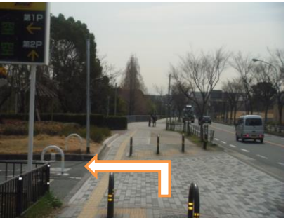
28 もう少しです頑張ろう