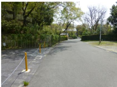
28 もう少しです頑張ろう