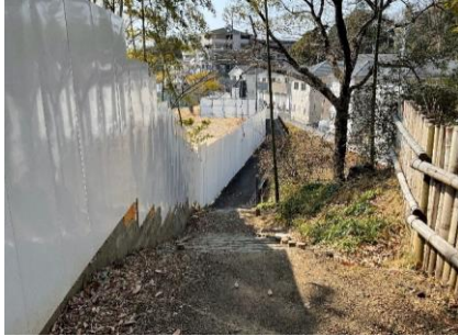
23 歩道をゆっくり歩きましょう