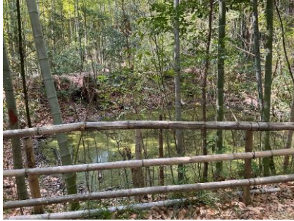
20 最後の下りです。あわてずゆっくり。