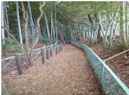
8 いろんな種類の柵(サク)をみつけられるかな