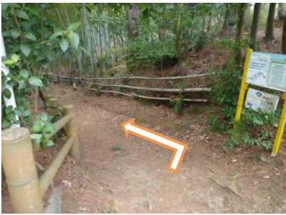
19 ゆっくり気をつけて歩きましょう