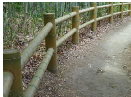
14 この柵(サク)は竹かな?