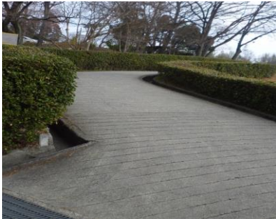
4 上り坂 ゆっくり行こう