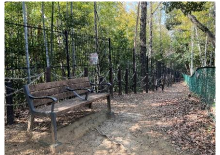
9 ちょっとひと休み!