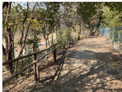
13 野鳥の声は聞こえませんか?