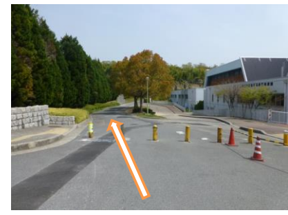
29 お疲れ様です(ゴールです)