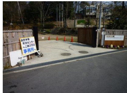
29 お疲れ様です(ゴールです)