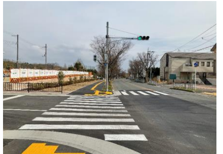
27 わんぱく門から入らず、本館正面入口へ